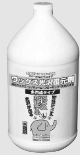
1 ガロン (約 4L) 容器