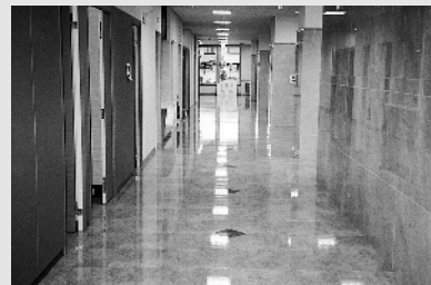
【写真1】ホモジニアスピニルタイル