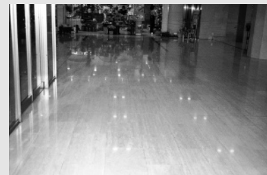
【写真4】大理石 (トラバーチン)