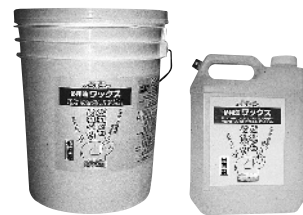
【写真左】 5 ガロン (約20L) 缶 2000㎡塗布可能 【写真右】 1 ガロン (約4L) 容器 400㎡塗布可能

前回は、この商品の特長として、以下の14項目について説明いたしました。このほかにも、8つの大きな特長がございます。