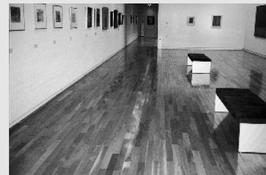
【写真2】フローリング