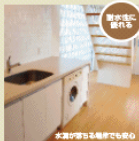
リビングのフローリング