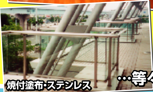
焼付塗布・ステンレス