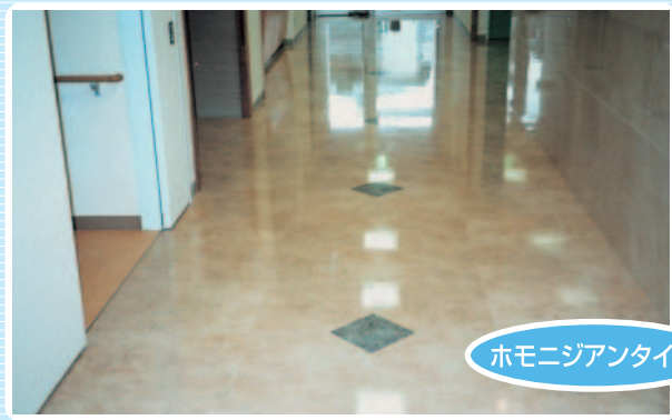
ホモジアンタイル