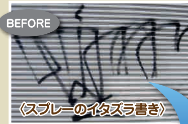
〈スプレーのイタズラ書き〉

原液をいたずらされた部分のみ塗ります。元の塗料に掛からないように注意します。一緒にはがれます。