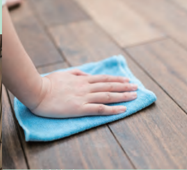
吐き戻し 粗相の汚れ