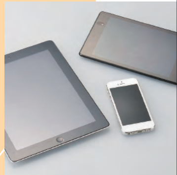
液晶画面 (スマートフォン・タブレット)