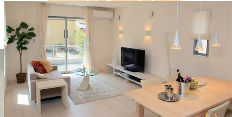
リビング (ソファ・カーペット・白木の床・TV・家具全般)